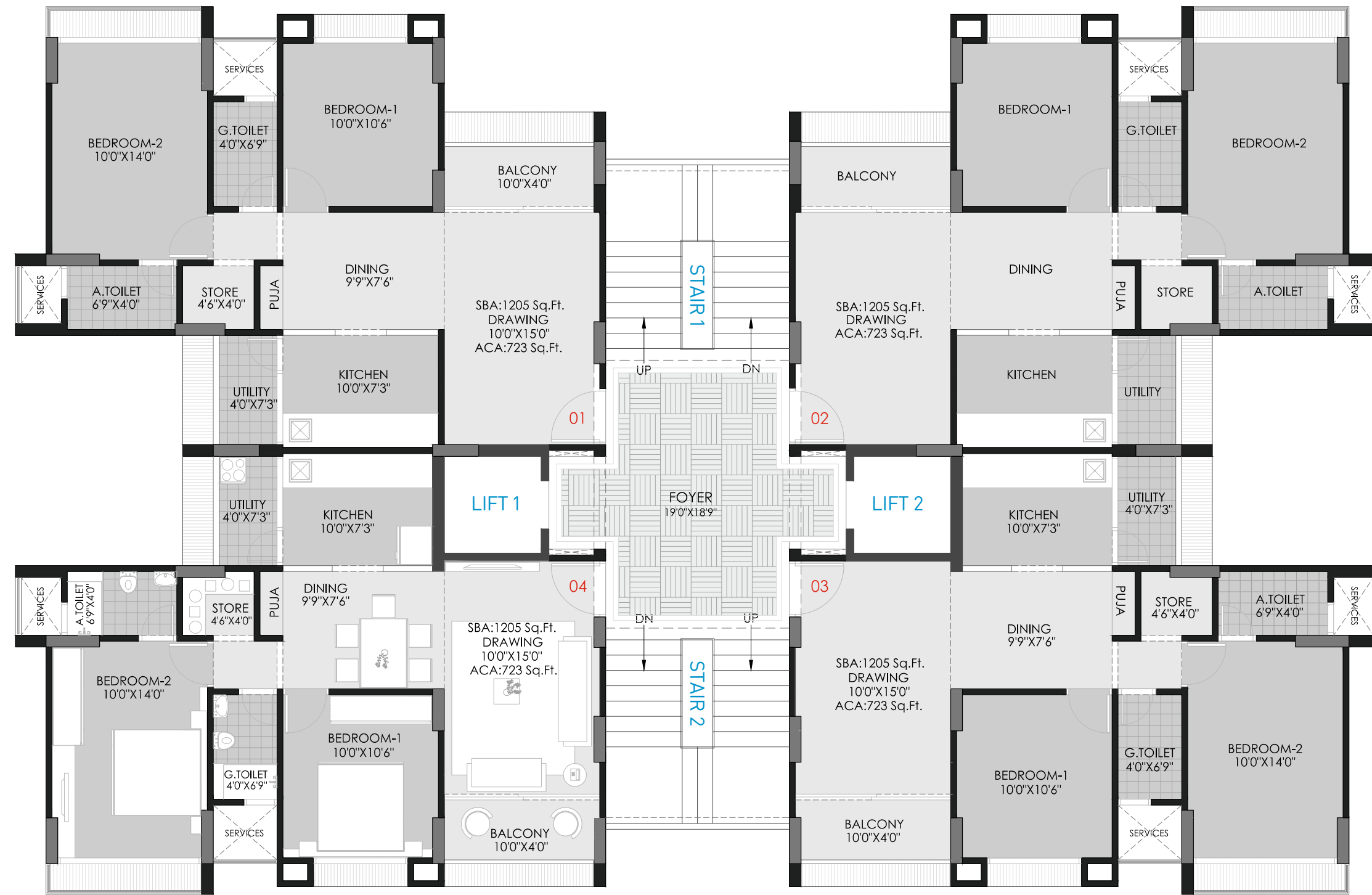
Block : S & U UNIT PLAN 1205 Sq. Ft. (S.B.A.)