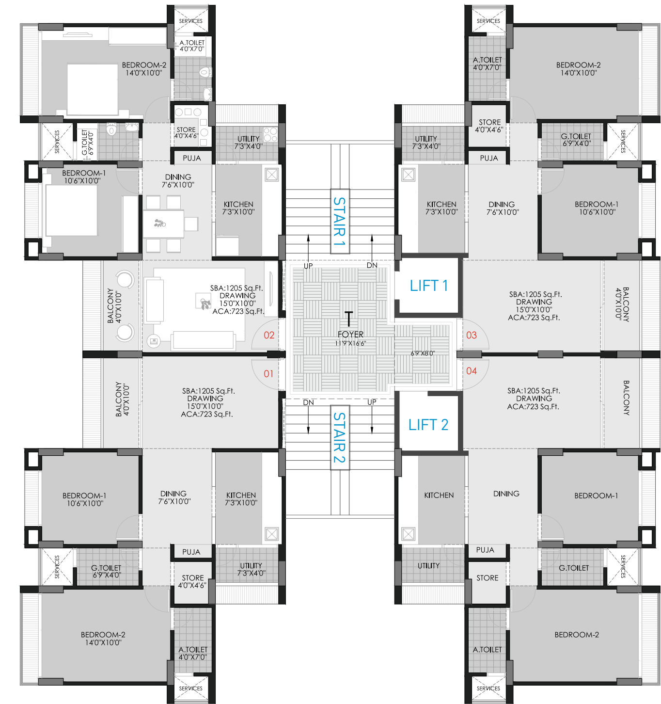
Block : T UNIT PLAN 1205 Sq. Ft. (S.B.A.)