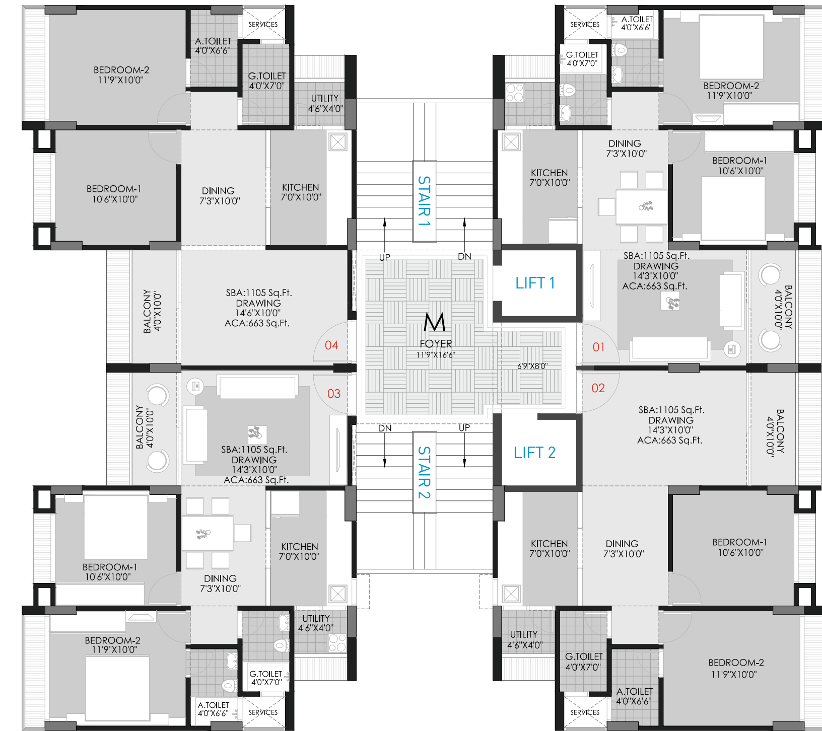
Block : M UNIT PLAN 1105 Sq. Ft. (S.B.A.)