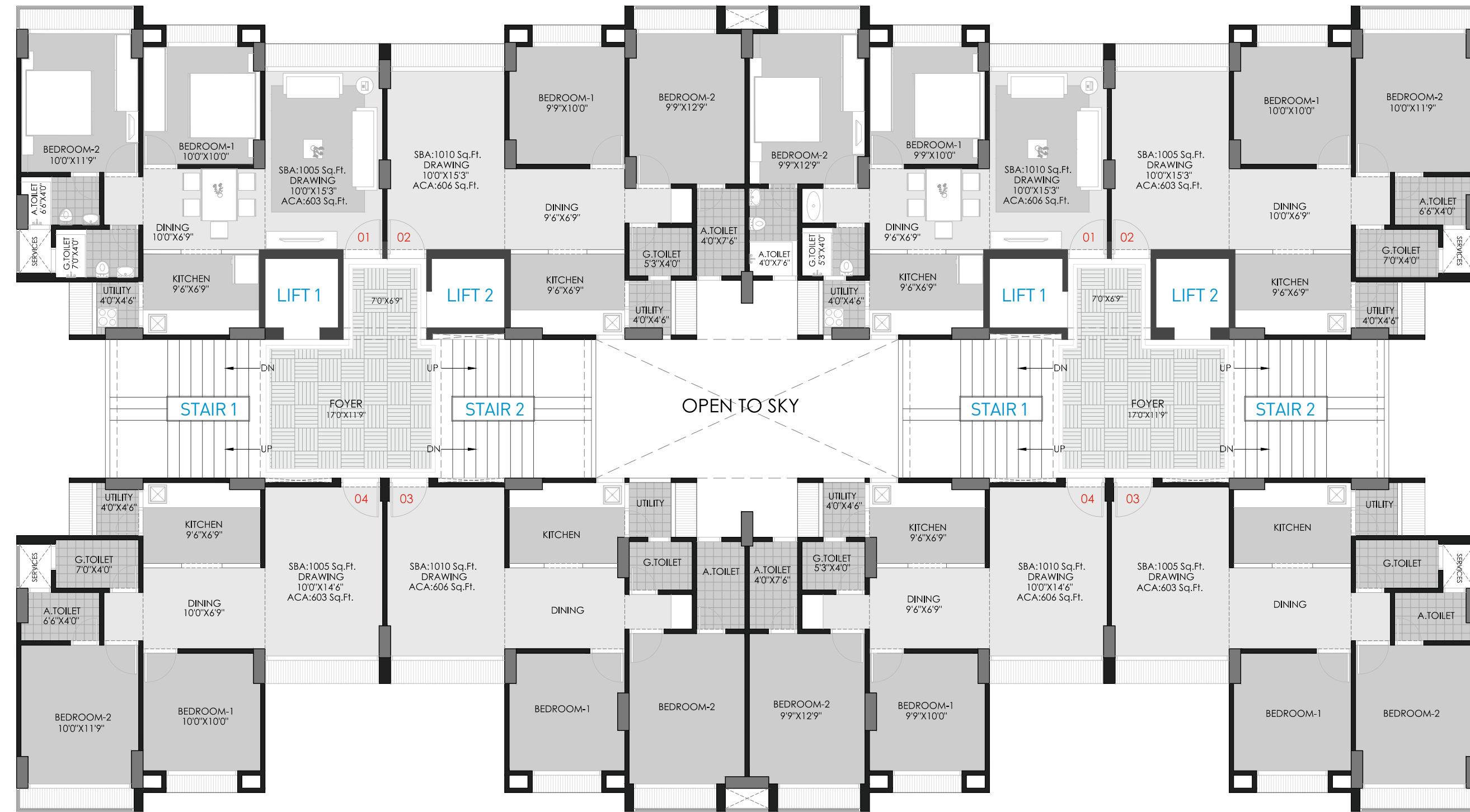
Block : A+B, C+D, E+F, G+H, I+J, K+L UNIT PLAN 1005 & 1010 Sq. Ft. (S.B.A.)