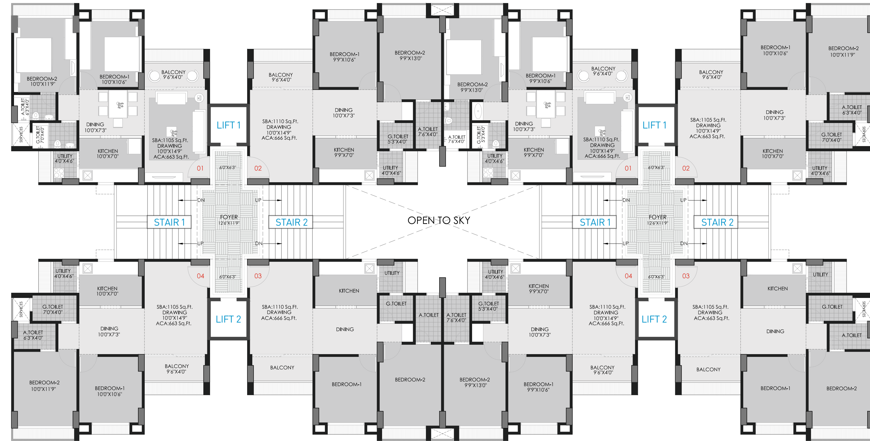
Block : N+O, Q+R, UNIT PLAN 1105 & 1110 Sq. Ft. (S.B.A.)