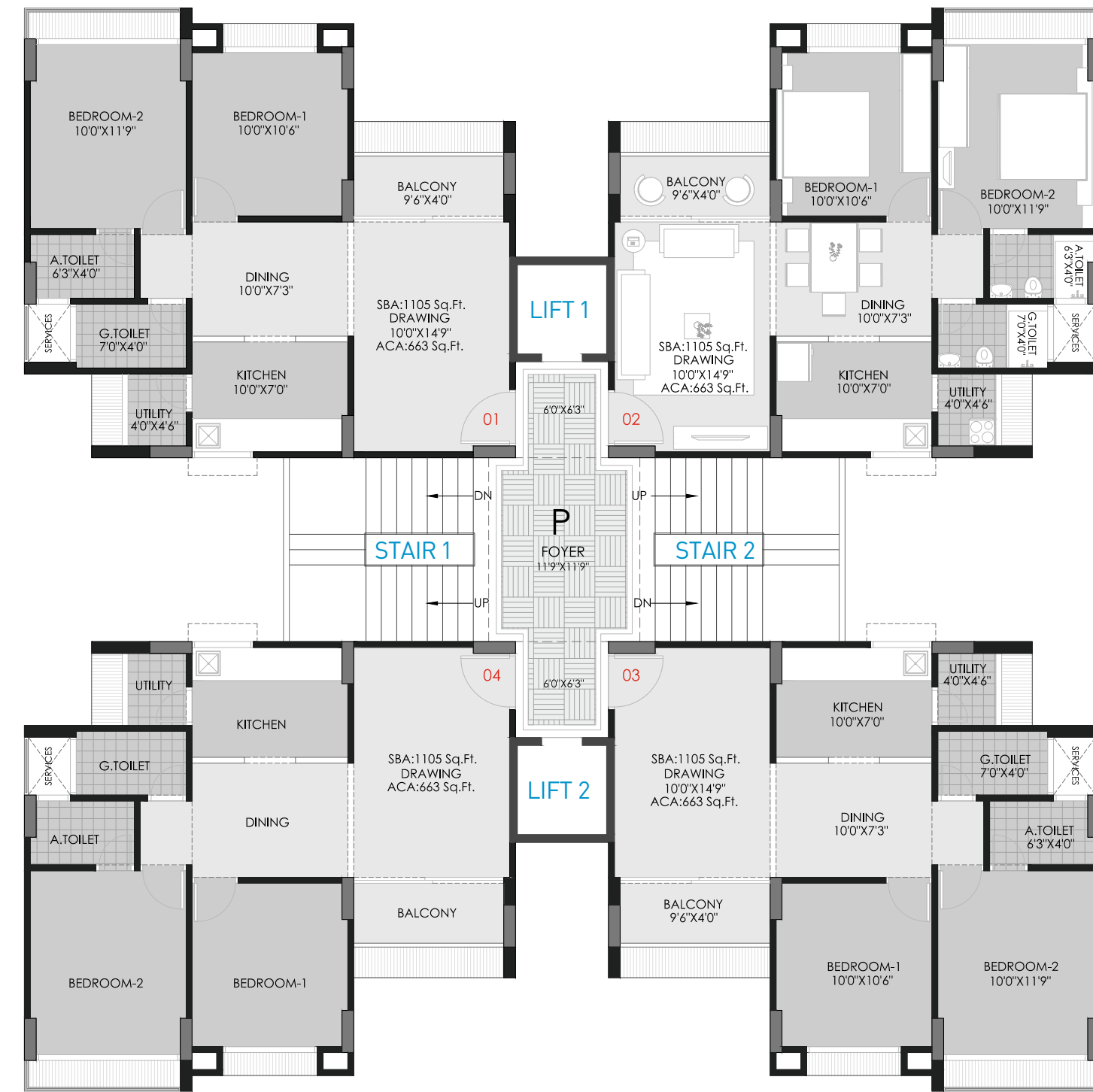
Block : P UNIT PLAN 1105 Sq. Ft. (S.B.A.)